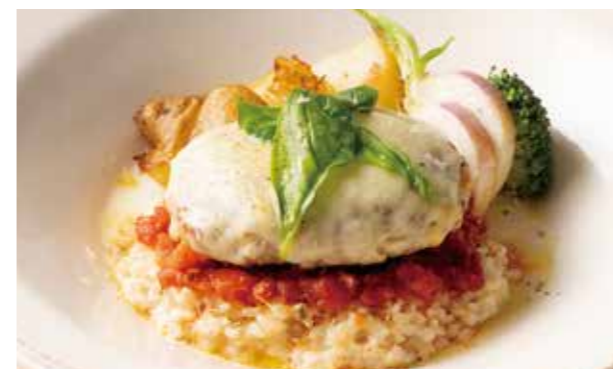
イタリアンハンバーグ 1,690 (税込1,859) Italian Style Hamburg Steak