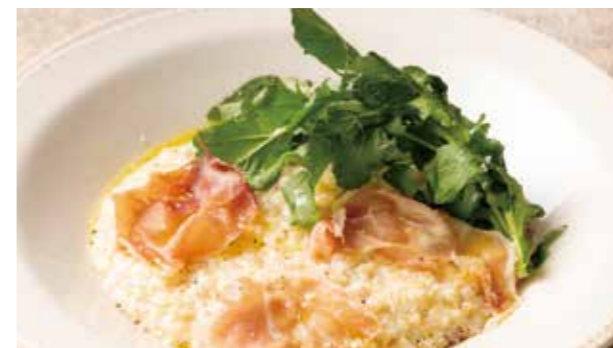
生ハムとグラナパダーノの 玄米リゾット 1,390 (税込1,529) Brown Rice Risotto with Dry-cured Ham & Grana Padano Cheese