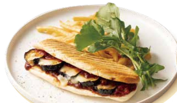
茄子のボロネーゼ&チーズパニーニ Bolognese with Eggplant & Cheese Panini 1,290 (税込1,419)