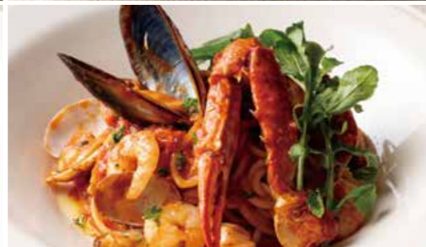
魚介たっぷりペスカトーレ 1,590 (税込1,749) Seafood Pescatore Spaghettini