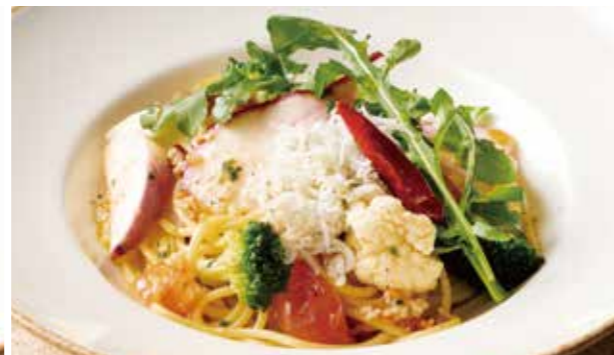
季節野菜としらすのアリオオーリオ 1,390 (税込1,529) Garlic & Olive Oil Spaghettini with Vegetables & Whitebait