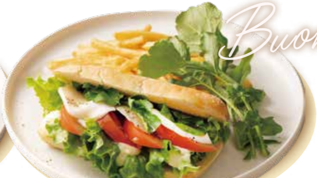
モzzarellaチーズ&ハーブパニーニ Mozzarella Cheese & Herb Panini 1,390 (税込1,529)