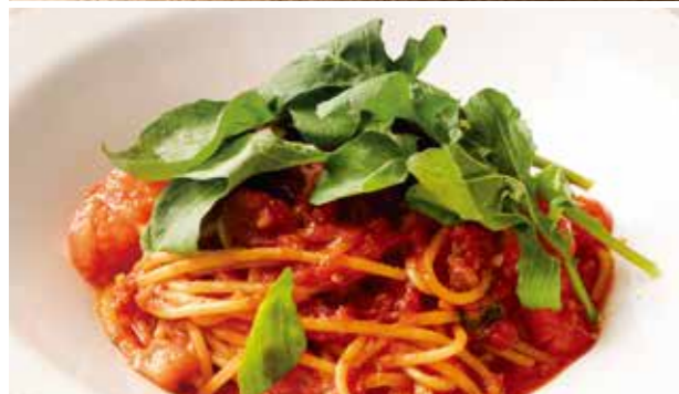
バジル&ポモドーロ 1,390 (税込1,529) Spaghettini with Tomato & Fresh Basil