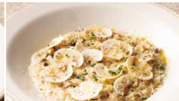
ポルチーニときのこの クリーム玄米リゾット 1,490 (税込1,639) Brown Rice Cream Risotto with Porcini & Mushroom