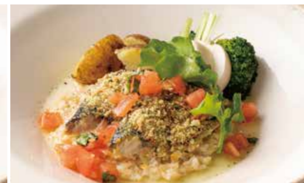
鯖の香草パン粉焼きケッカソース 1,790 (税込1,969) Herb-Crusted Baked Mackerel with Checca Sauce