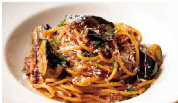
茄子の濃厚ボロネーゼ 1,390 (税込1,529) Rich Bolognese Spaghettini with Eggplant