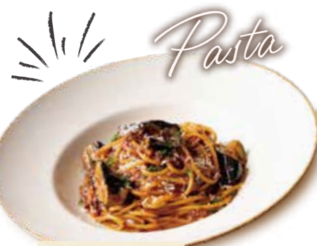
サラダ付き w/ Salad