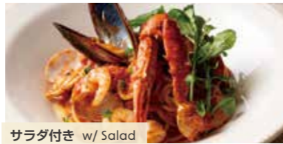
サラダ付き w/ Salad