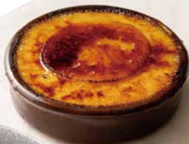
自家製オレンジ カタラーナ Homemade Orange Catalana 690 (税込759)