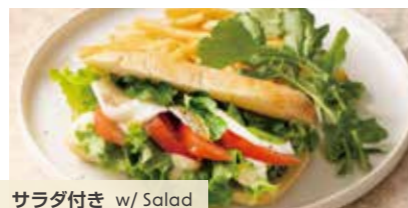
サラダ付き w/ Salad