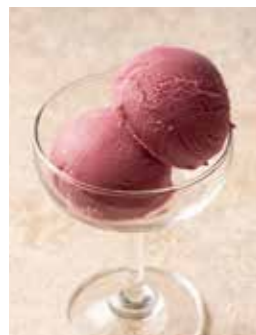
季節の ジェラート Seasonal Gelato 590 (税込649)