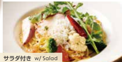
サラダ付き w/ Salad