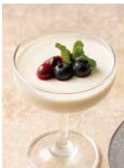
自家製 パンナコッタ Homemade Panna Cotta 690 (税込759)