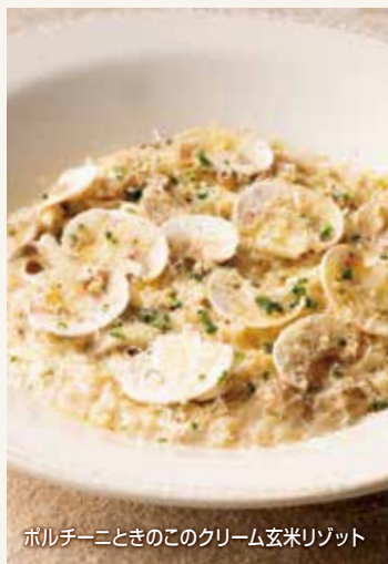
ポルチーニときのこのクリーム玄米リゾット

ポルチーニときのこのクリーム玄米リゾット 1,390 Brown Rice Cream Risotto with Porcini & Mushroom