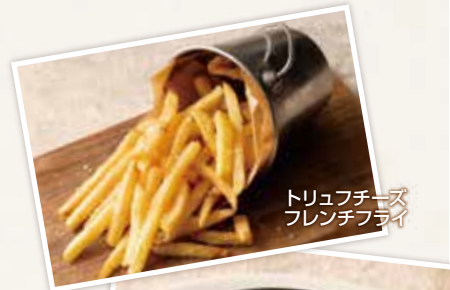
トリュフチーズ フレンチフライ