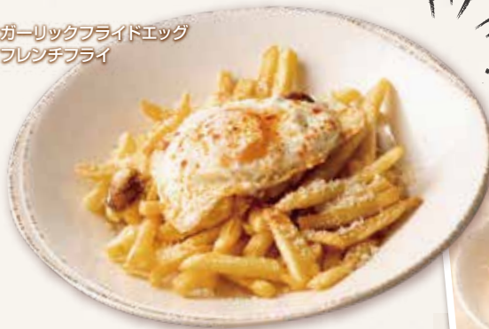
ガーリックフライドエッグ フレンチフライ