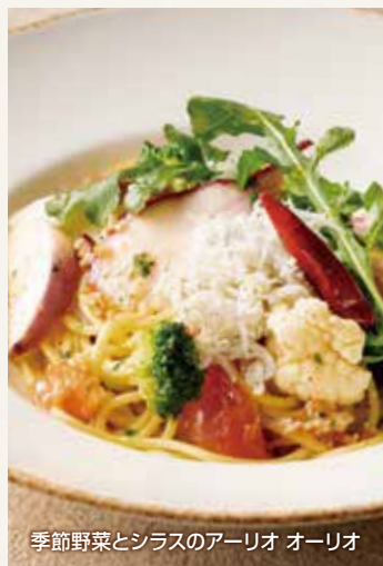
季節野菜とシラスのアーリオ オーリオ