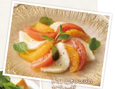
トマトとオレンジの カプレーゼ