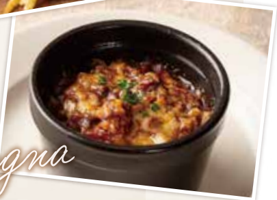
濃厚ボロネーゼのミニラザニア