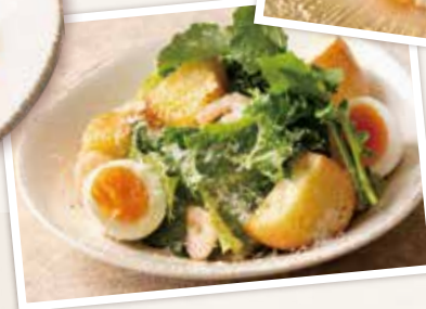
ロメインレタスと グラナパダーノのシーザー仕立て