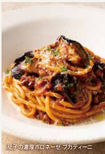
茄子の濃厚ボロネーゼ ブカティーニ