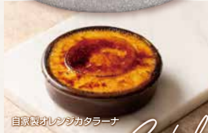
自家製オレンジカタラーナ