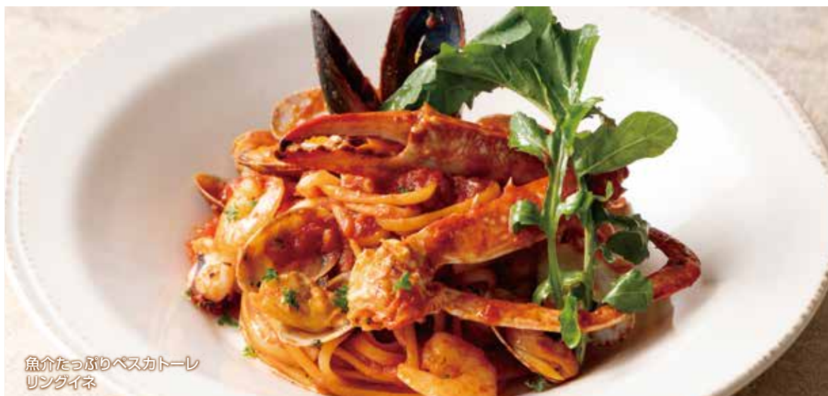
魚介たっぷりペスカトーレ リングイネ