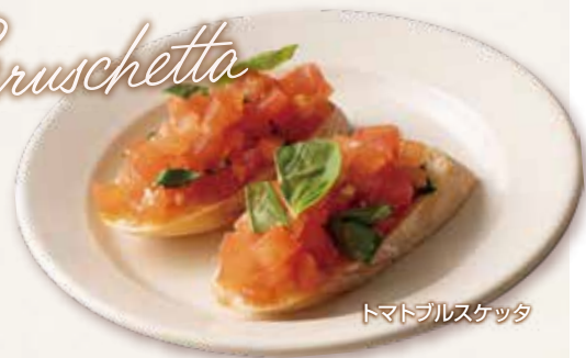
トマトブルスケッタ