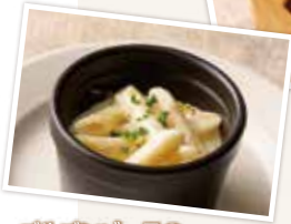
ゴルゴンゾーラの ミニペンネ