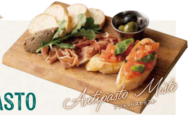
Antipasto Misto アンティパストミスト