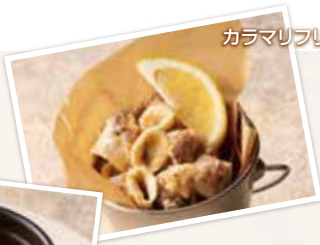
カラマリフリット