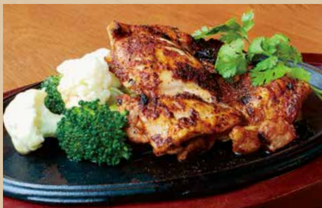
鶏もも肉のグリル

Cajun Meatball Spaghetti ゴロツとミートボールとトマトソースのコンビ