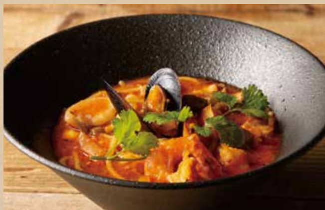
チョッピーノ風シーフーズープパスタ 1,290 (税込1,419)

Tomato Cream Sauce Spaghetti with Prosciutto & Seasonal Vegetables 季節ごとにかわる野菜の食感と生ハムのアクセント!