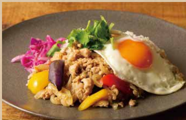
ガパオライス 1,290 (税込1,419)

Creole Gumbo Plate [ includes Rice ] ガンボ (オクラ) とたっぷりの具材をトマトとスパイスで煮込んだスープ