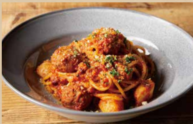
ケイジャンミートボールパスタ