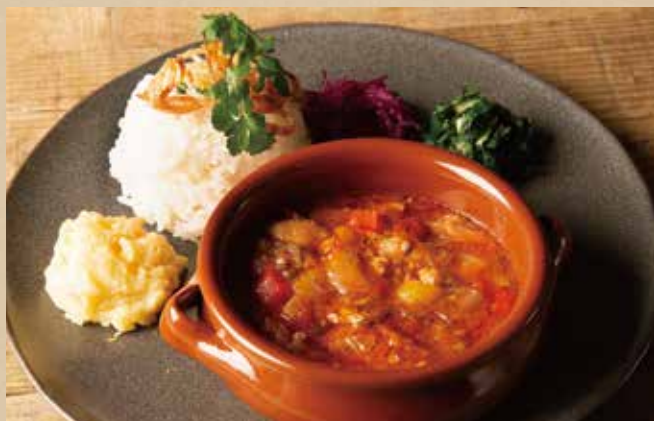
クレオール風ガンボプレート [ライス付] 1,190 (税込1,309)

Cioppino Seafood Soup Spaghetti たっぷりの魚介類を煮込んだパイヤベース風スープのパスタ