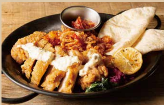
フライドチキンファフィータ [ジャンバラヤ・トルティーヤ付]

Grilled Chicken [ Rice Sold Separately + 100yen (incl.tax 110yen) ]