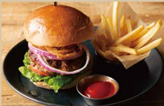
キャロルバーガー [フレンチフライ付]