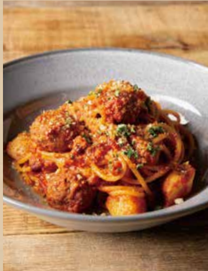
ケイジャンミートボールパスタ [ミニサラダ付] 1,090 (税込1,199) Cajun Meatball Spaghetti [ includes Mini Salad ] グロッとミートボールとトマトソースのコンビ