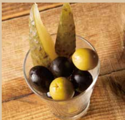
オリーブ&ピクルス 400 (税込440) Olives & Pickles さっぱりとした酸味で、お酒がすすむ!