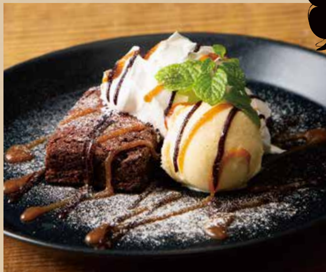
チョコレートブラウニー バニラアイス添え [ドリンク付]

Chocolate Brownie with Vanilla Ice Cream [includes Drink]