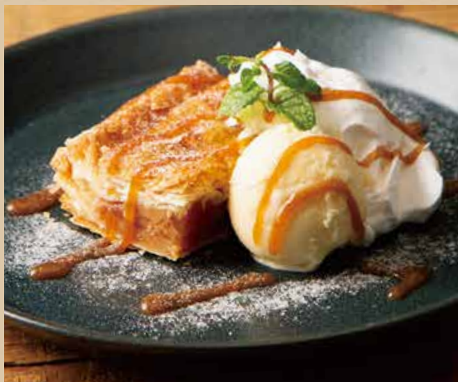
アップルパイ バニラアイス添え [ドリンク付]

Apple Pie with Vanilla Ice Cream [includes Drink]