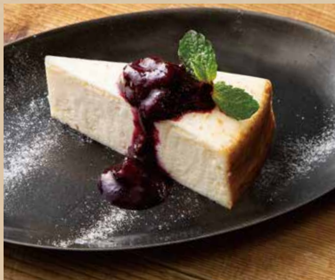
NYチーズケーキ [ドリンク付]