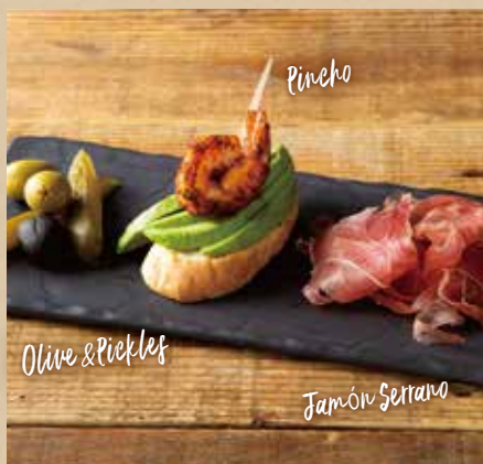
前菜3種盛り合わせ 719 (税込790) Assorted Appetizers ハモンセララー、本日のピンチョス、オリーブ&ピクルス