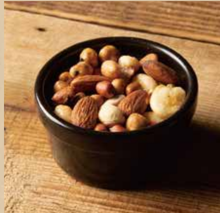
燻製ナッツ 400 (税込440) Smoked Nuts スモーク好きにはたまらない、ミックスナッツ