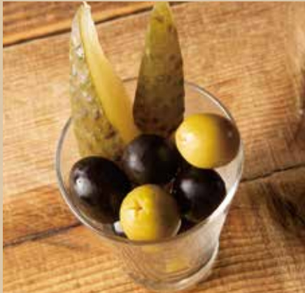
オリーブ&ピクルス 400 (税込440) Olives & Pickles さっぱりとした酸味で、お酒がすすむ!