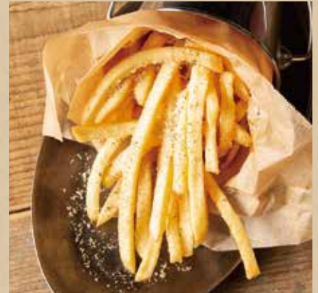
フレンチフライ 各 582 (税込640) [ガーリック or トリュフチーズ] French Fries [Garlic or Truffle Cheese] 好きなフレーバーをお選びください