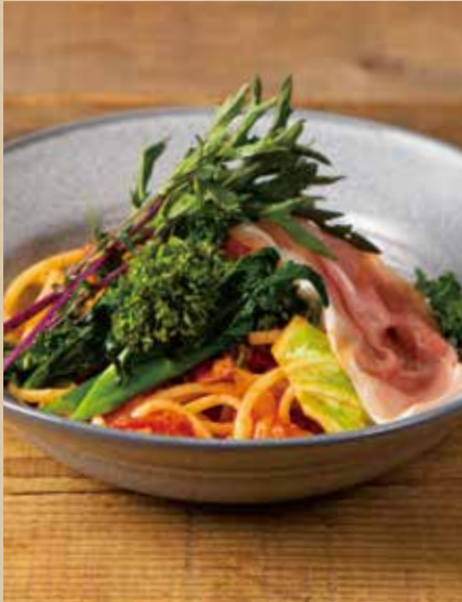
生ハムと季節野菜のトマトクリームパスタ [ミニサラダ付] 1,140 (税込1,254)

Tomato Cream Sauce Spaghetti with Prosciutto & Seasonal Vegetables [ includes Mini Salad ] 季節ごとにかわる野菜の食感と生ハムのアクセント!