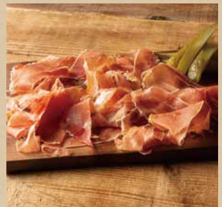
ハモンセララーノ 900 (税込990) Jamon Serrano 切りたての風味と格別な舌触り

季節や仕入状況により内容が変更になる場合もございますのでご了承ください。お米の産地情報については係りの者にお尋ねください。〈食物アレルギーがご心配のお客様へ〉1.当店ではアレルギー28品目の使用リストをご用意しておりますので係りの者にお尋ねください。2.当店で使用している魚介類には、えび・かに等が混在している場合があります。3.アレルギー物質に対する感受性には個人差があります。使用する原材料の製造工場や店舗内においては、同一の調理器具・洗浄機を使用しておりますので、微量でも反応してしまう可能性のあるお客様はご注意ください。Please note that the content is subject to change depending on the season or stock. For information about the production area of rice, please kindly ask one of our staff members. 〈For customers with food allergies〉 1) An allergen list of 28 items is available. Please feel free to ask our staff. 2) Shrimps and crabs may be contained in the seafood ingredients we use at our restaurant. 3) Tolerance against allergen varies among individuals. Since our preparation and cooking process involves shared cookware and dishwasher, please be extra cautious if you react to a slight amount of allergen.