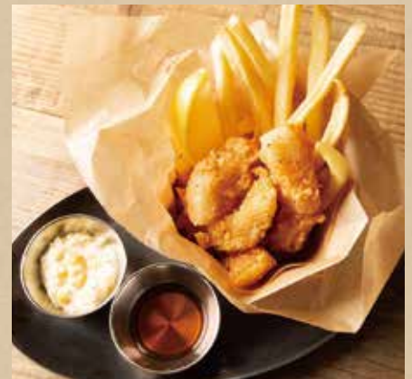
フィッシュ&チップス 900 (税込990) Fish & Chips 白身魚とポテトフライの鉄板コンビ