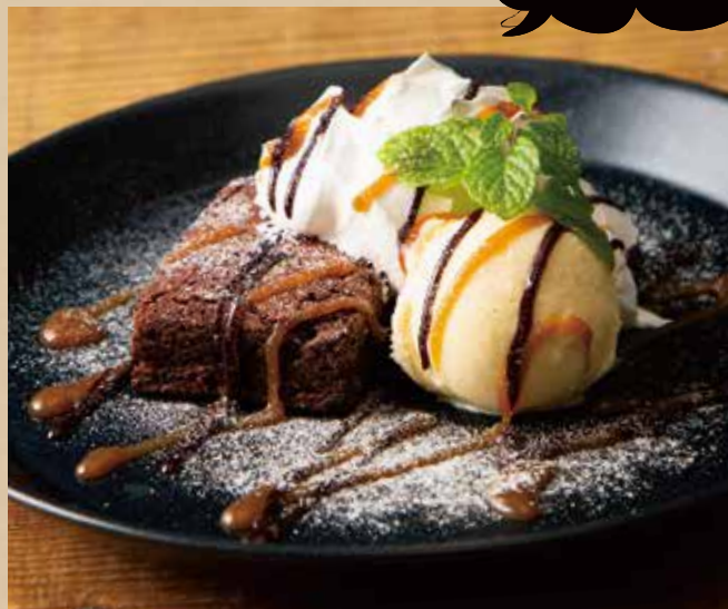
チョコレートブラウニー バニラアイス添え [ドリンク付]

Chocolate Brownie with Vanilla Ice Cream [ includes Drink ] アメリカと言えばブラウニーでしょ!