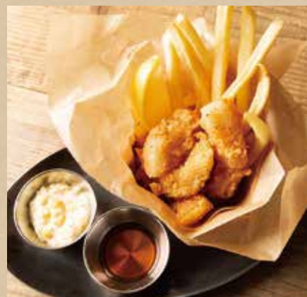
フィッシュ&チップス 810 (税込890) Fish & Chips 白身魚とポテトフライの鉄板コンビ