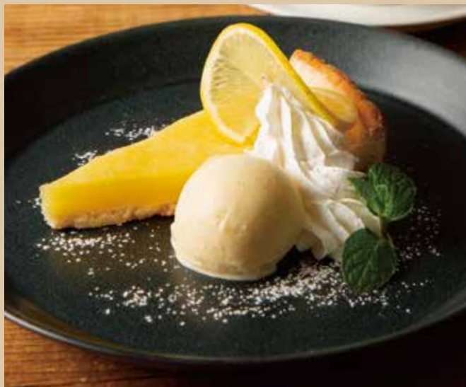
レモンタルト バニラアイス添え [ドリンク付]

Lemon Tart with Vanilla Ice Cream [ includes Drink ] 爽やかなレモンの酸味とバニラアイスがベストマッチ