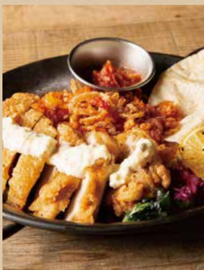
フライドチキンファフィータ [ジャンバラヤ・トルティーヤ・ミニサラダ付] 1,140 (税込1,254)

Creole Gumbo Plate [ includes Rice, Mini Salad ] ガンボ (オクラ) やトマトなどたっぷりの具材をケイジャンスパイスで煮込んだスープ