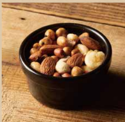
燻製ナッツ 400 (税込440) Smoked Nuts スモーク好きにはたまらない、ミックスナッツ