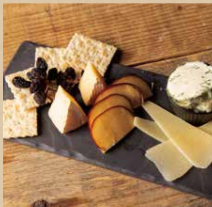
チーズプラッター 890 (税込979) Cheese Platter ワインとの組み合わせを楽しみたい、4つのチーズアソート。