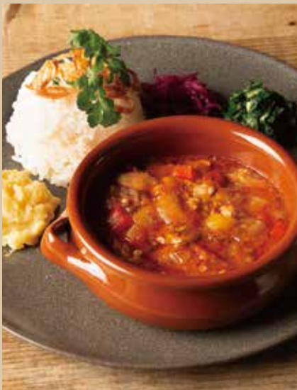
クレオール風ガンボプレート [ライス・ミニサラダ付] 1,040 (税込1,144) Creole Gumbo Plate [ includes Rice, Mini Salad ] ガンボ (オクラ) やトマトなどたっぷりの具材をケイジャンスパイスで煮込んだスープ。