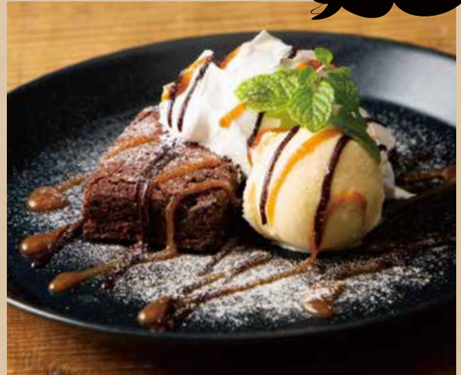
チョコレートブラウニー バニラアイス添え [ドリンク付]

Chocolate Brownie with Vanilla Ice Cream [ includes Drink ] アメリカと言えばブラウニーでしょ!