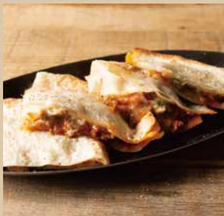
ケサディーヤ 582 (税込640) Quesadilla チリコンカルネと熱々チーズがとろける一品。