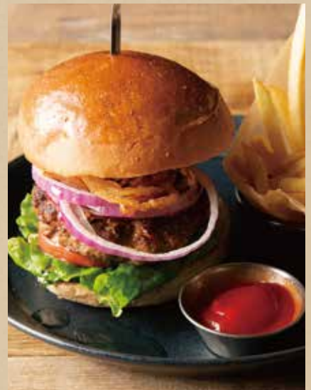
キャロルバーガー [フレンチフライ] 1,140 (税込1,254) [ミニサラダ付] CARROLL Burger [ includes French Fries, Mini Salad ] ジューシーな肉汁溢れるビーフパティ。