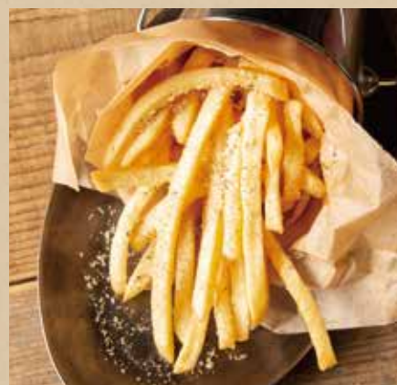
フレンチフライ 各 491 (税込540) [ガーリック or トリュフチーズ] French Fries [Garlic or Truffle Cheese] 好きなフレーバーをお選びください。