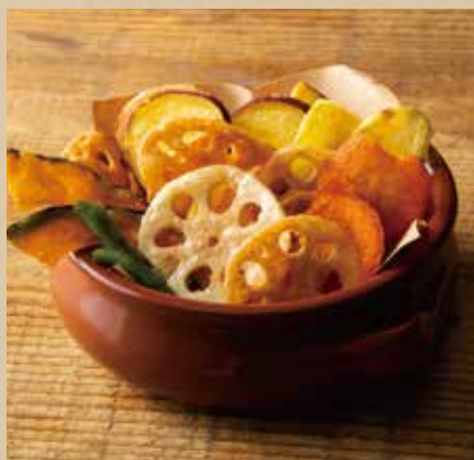
野菜チップス 719 (税込790) Mixed Vegetable Chips レンコンなどいろいろ野菜のチップス。