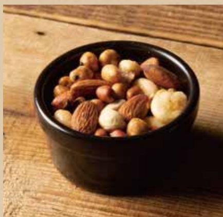
燻製ナッツ 400 (税込440) Smoked Nuts スモーク好きにはたまらない、ミックスナッツ。