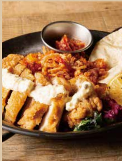
フライドチキンファフィータ [ジャンバラヤ・トルティーヤ・ミニサラダ付] 1,140 (税込1,254) Fried Chicken Fajita [ includes Jambalaya, Tortilla, Mini Salad ] サクサクなクリスピーフライドチキンと濃厚タルタルが相性抜群。