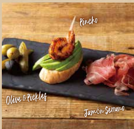
前菜3種盛り合わせ 719 (税込790) Assorted Appetizers ハモンセラノ、本日のピンチョス、オリーブ&ピクルス。