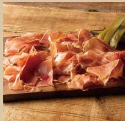
ハモンセラノ 900 (税込990) Jamón Serrano 切りたての風味と格別な舌触り。

季節や仕入状況により内容が変更になる場合もございますのでご了承ください。お米の産地情報については係りの者にお尋ねください。〈食物アレルギーがご心配のお客様へ〉1.当店ではアレルギー28品目の使用リストをご用意しておりますので係りの者にお尋ねください。2.当店で使用している魚介類には、えび・かに等が混在している場合があります。3.アレルギー物質に対する感受性には個人差があります。使用する原材料の製造工場や店舗内においては、同一の調理器具・洗浄機を使用しておりますので、微量でも反応してしまう可能性のあるお客様はご注意ください。Please note that the content is subject to change depending on the season or stock. For information about the production area of rice, please kindly ask one of our staff members. 〈For customers with food allergies〉1) An allergen list of 28 items is available. Please feel free to ask our staff. 2) Shrimps and crabs may be contained in the seafood ingredients we use at our restaurant. 3) Tolerance against allergen varies among individuals. Since our preparation and cooking process involves shared cookware and dishwasher, please be extra cautious if you react to a slight amount of allergen.