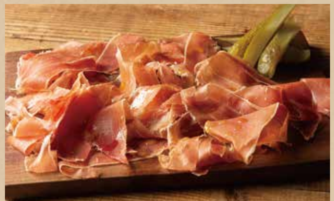
ハモンセラノ 900 (税込990) Jamon Serrano 切りたての風味と格別な舌触り。

季節や仕入状況により内容が変更になる場合もございますのでご了承ください。お米の産地情報については係りの者にお尋ねください。〈食物アレルギーがご心配のお客様へ〉1.当店ではアレルギー28品目の使用リストをご用意しておりますので係りの者にお尋ねください。2.当店で使用している魚介類には、えび・かに等が混在している場合があります。3.アレルギー物質に対する感受性には個人差があります。使用する原材料の製造工場や店舗内においては、同一の調理器具・洗浄機を使用しておりますので、微量でも反応してしまう可能性のあるお客様はご注意ください。Please note that the content is subject to change depending on the season or stock. For information about the production area of rice, please kindly ask one of our staff members. 〈For customers with food allergies〉 1) An allergen list of 28 items is available. Please feel free to ask our staff. 2) Shrimps and crabs may be contained in the seafood ingredients we use at our restaurant. 3) Tolerance against allergen varies among individuals. Since our preparation and cooking process involves shared cookware and dishwasher, please be extra cautious if you react to a slight amount of allergen.