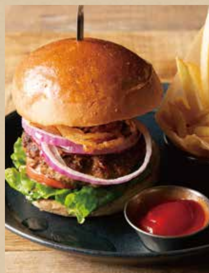
キャロルバーガー [フレンチフライ] 1,128 (税込1,240) [ミニサラダ付] CARROLL Burger [ includes French Fries, Mini Salad ] ジューシーな肉汁溢れるビーフパティ。