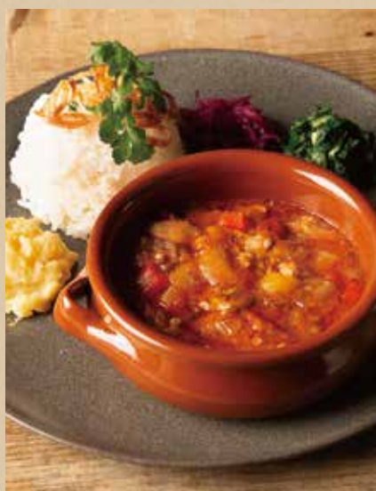
クレオール風ガンボプレート [ライス・ミニサラダ付] 1,036 (税込1,140) Creole Gumbo Plate [ includes Rice, Mini Salad ] ガンボ(オクラ) やトマトなどたっぷりの具材を ケイジャンスパイスで煮込んだスープ。