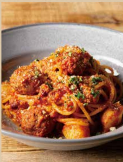
ケイジャンミートボールパスタ [ミニサラダ付] 1,037 (税込1,140) Cajun Meatball Spaghetti [ includes Mini Salad ] グロッとミートボールとトマトソースのコンビ。