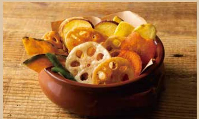
野菜チップス 719 (税込790) Mixed Vegetable Chips レンコンなどいろいろ野菜のチップス。