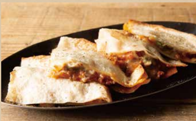
ケサディーヤ 582 (税込640) Quesadilla チリコンカルネと熱々チーズがとろける一品。