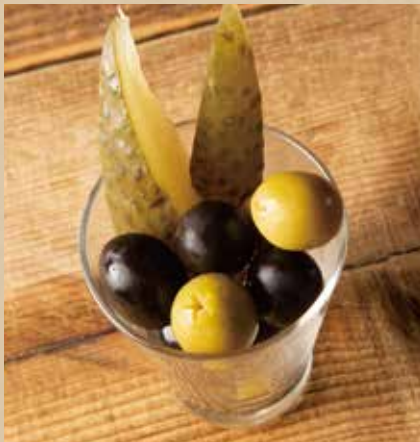
オリーブ&ピクルス 400 (税込440) Olives & Pickles さっぱりとした酸味で、お酒がすすむ!