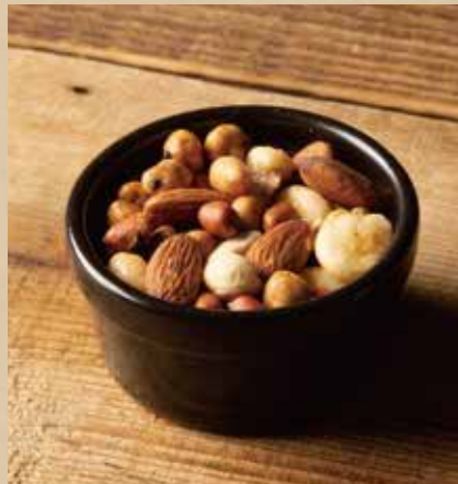
燻製ナッツ 400 (税込440) Smoked Nuts スモーク好きにはたまらない、ミックスナッツ。