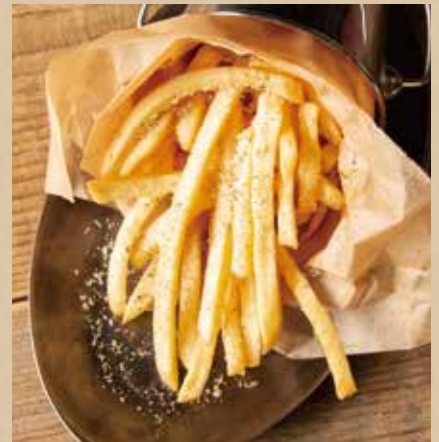
フレンチフライ 各 491 (税込540) [ガーリック or トリュフチーズ] French Fries [ Garlic or Truffle Cheese ] お好きなフレーバーをお選びください。