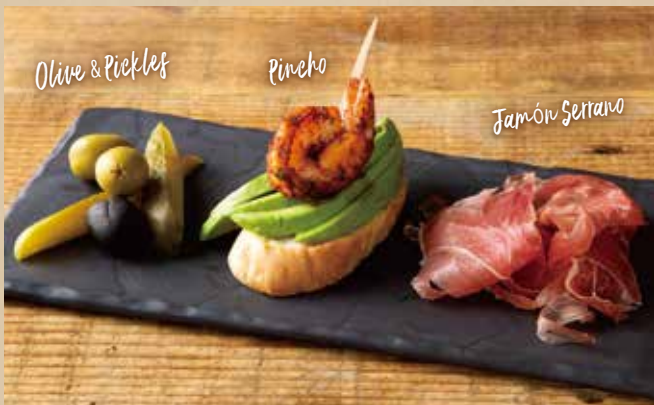
前菜3種盛り合わせ 719 (税込790) Assorted Appetizers ハモンセラノ、本日のピンチョス、オリーブ&ピクルス。