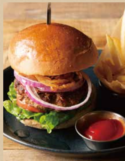
キャロルバーガー [フレンチフライ] 1,100 (税込1,210) [ミニサラダ付]

CARROLL Burger [ includes French Fries, Mini Salad ]