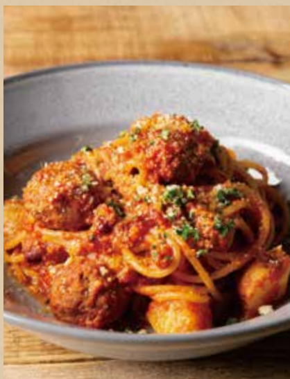
ケイジャンミートボールパスタ [ミニサラダ付] 1,000 (税込1,100)

Cajun Meat Ball Spaghetti [ includes Mini Salad ]