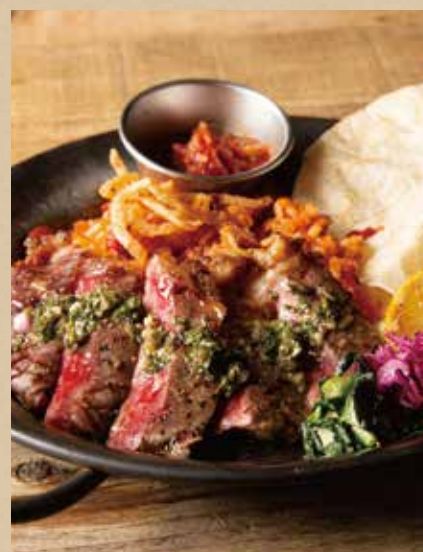
グリルビーフファフィータ [ジャンバラヤ・トルティーヤ・ミニサラダ付] 1,600 (税込1,760)

Grilled Beef Fajita [ includes Jambalaya, Tortilla, Mini Salad ]