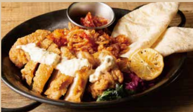
フライドチキンファジータ [ジャンバラヤ・トルティーヤ付] 1,340 (税込1,474)

[ ライス別売 +100 (税込110) ] 400g 1,790 (税込1,969) Grilled Chicken [ Rice Sold Separately + 100yen (incl.tax 110yen) ]