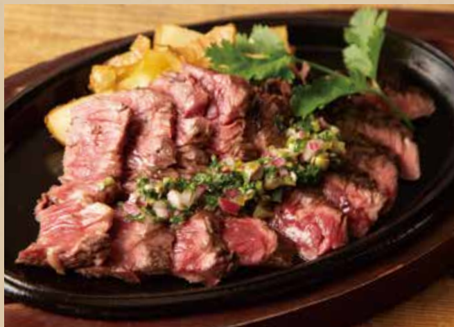
牛ハラミステーキ [ライス付] 1,740 (税込1,914)

Beef Skirt Steak with Chimichurri Sauce [ includes Rice ] ガーリック、パセリ、オレガノが効いたチミチュリソースでさっぱりと