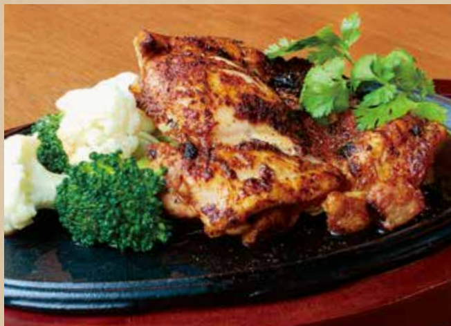
鶏もも肉のグリル 200g 1,390 (税込1,529)

Beef Skirt Steak with Chimichurri Sauce [ includes Rice ] ガーリック、パセリ、オレガノが効いたチミチュリソースでさっぱりと