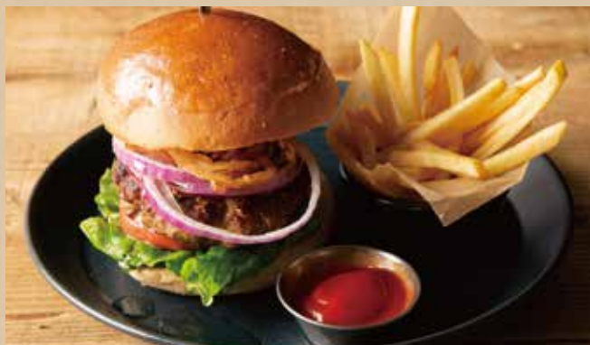
キャロルバーガー [フレンチフライ付] 1,340 (税込1,474)

Fried Chicken Fajita [ includes Jambalaya, Tortilla ] サクサクなクリスピーフライドチキンと濃厚タルタルが相性抜群